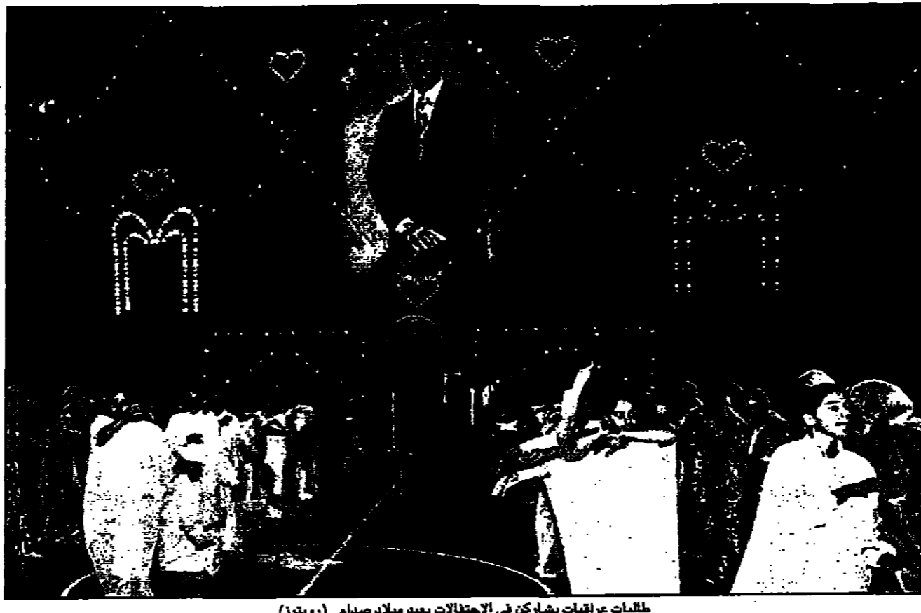
طلبايات عراقيات يشاركن في الاحتفالات بعيد ميلاد صدام

بغداد - من فاروق شكري: شدد العراق لهجته أمس ضد مجلس الأمن مطالباً بأن يخصص للجنس الذكوري على رفع الحظر وليس على الإبقاء عليه كما هو متوقع أن يحصل اليوم. وأعترض وزير الثقافة والإعلام العراقي هادي العامري على مشروع القرار الذي تقدمت عليه المجموعة من الدولتين العضويتين في المجلس الآسلة النووية طيس كافي. وقال عبد الظهور في تصريح وكالة الأنباء العراقية إن مشروع القرار الذي تقدمت عليه المجموعة من الدولتين العضويتين في المجلس الآسلة النووية طيس كافي. وأضاف عبد الظهور في تصريح وكالة الأنباء العراقية إن مشروع القرار الذي تقدمت عليه المجموعة من الدولتين العضويتين في المجلس الآسلة النووية طيس كافي. وأضاف عبد الظهور في تصريح وكالة الأنباء العراقية إن مشروع القرار الذي تقدمت عليه المجموعة من الدولتين العضويتين في المجلس الآسلة النووية طيس كافي.